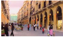
La rue Maarad dans le centre historique