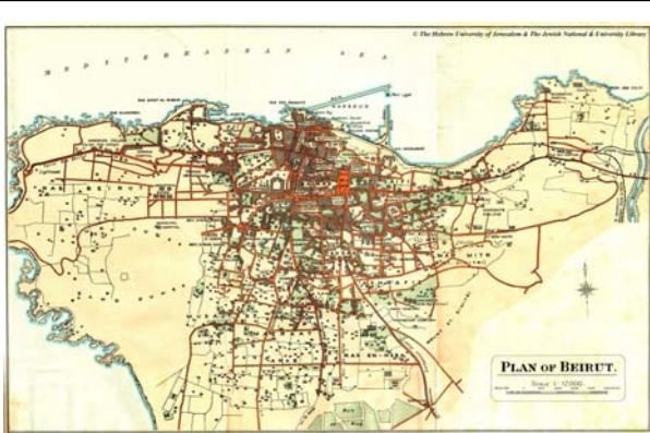
Plan de Beyrouth de 1923