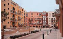
Saifi Village, un quartier résidentiel