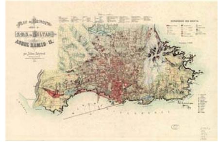
Plan de Beyrouth sous le règne du Sultan Abdel Hamid II (1876-1909), durant l'Empire Ottoman