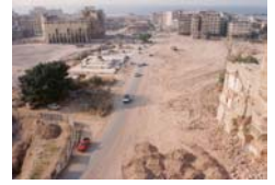
En 1994, après la guerre