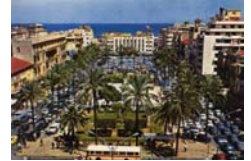
Dans les années 1970