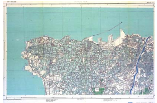
Carte de Beyrouth de 1964