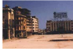
Pendant la guerre