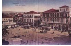
Au début du XX ème siècle: la Place des Canons