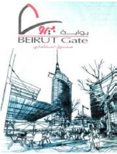
Développement foncier au sud de la Place des Martyrs